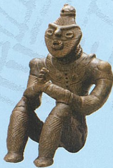
国宝「合掌土偶」 展示は複製品 (原品：八戸市所蔵)