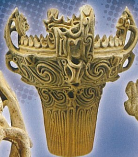
高精細複製品 (当館所蔵)