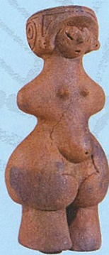
国宝「縄文のビーナス」 展示は複製品 (原品：茅野市所蔵)