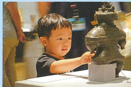
重文「遮光器土偶」高精細複製品のハンズオン活用