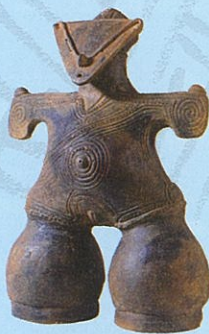
国宝「仮面の女神」 展示は複製品 (原品：茅野市所蔵)