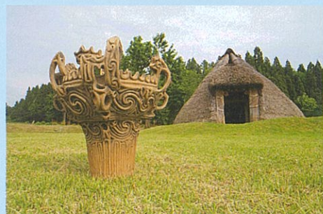
国宝「火焰型土器」高精細複製品の屋外での活用