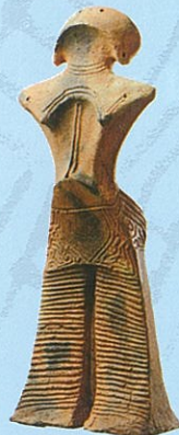
国宝「縄文の女神」 展示は複製品 (原品：山形県所蔵)