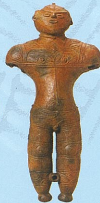
国宝「中空土偶」 展示は複製品 (原品：函館市所蔵)