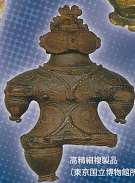
高精細複製品 (東京国立博物館所蔵)