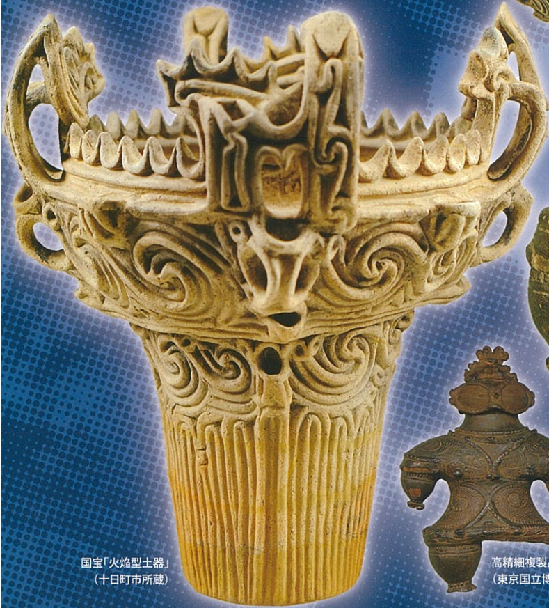
国宝「火焰型土器」 (十日町市所蔵)